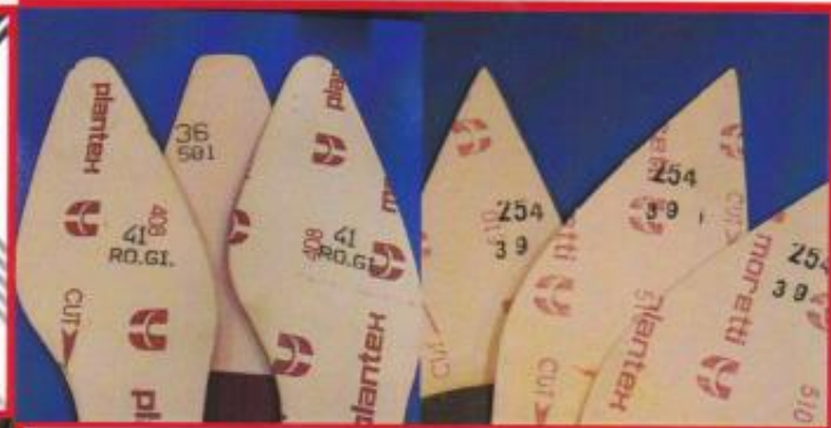
Timbratura automatica Timbratura alta risoluzione Automatic stamping Stamping of high resolution

Preso con pinza particolare regolabile in lunghezza, che assicura il trasporto dei sottopiedi fino a lavorazione